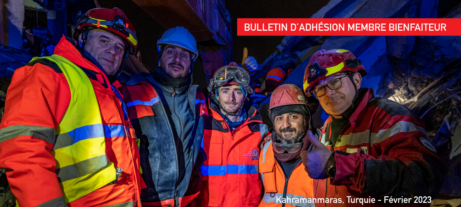
Kahramanmaras, Turquie - Février 2023

« Devenir Membre Bienfaiteur, c'est apporter son soutien, sa confiance et son aide à la réalisation des projets portés par la compétence et le dévouement de tous les bénévoles de notre ONG. »