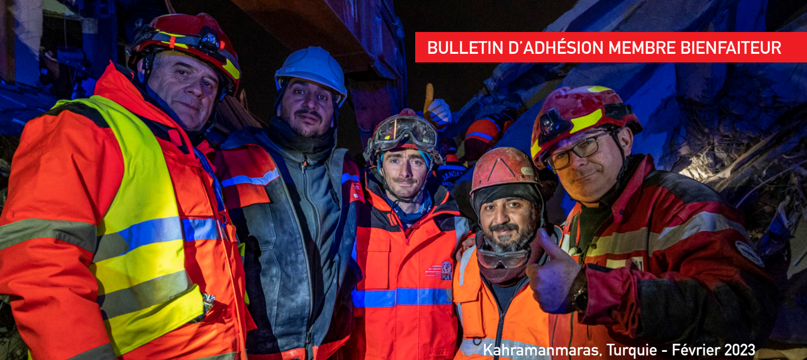
Kahramanmaras, Turquie - Février 2023

« Devenir Membre Bienfaiteur, c'est apporter son soutien, sa confiance et son aide à la réalisation des projets portés par la compétence et le dévouement de tous les bénévoles de notre ONG. »