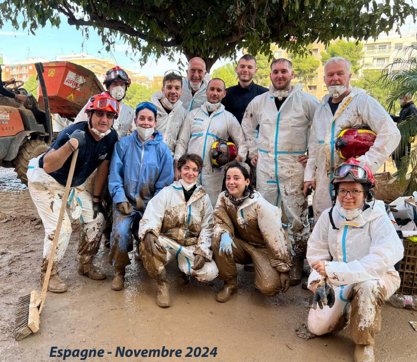
Espagne - Novembre 2024