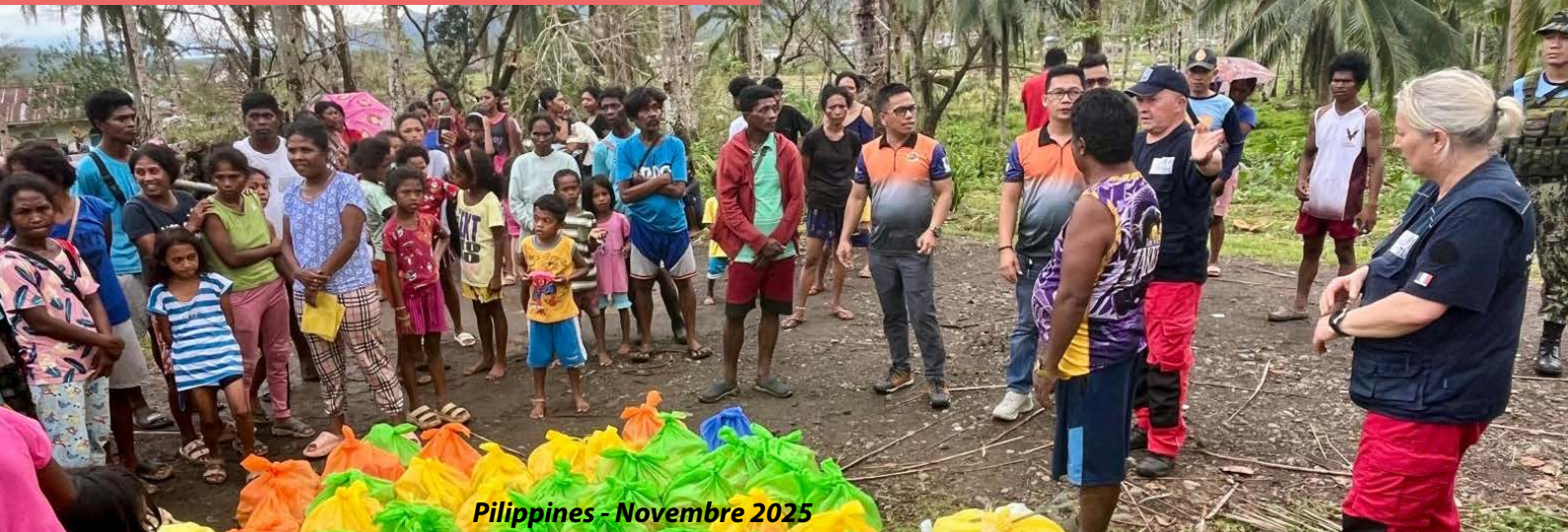
Pilippines - Novembre 2025

"Devenir Membre Bienfaiteur, c'est apporter son soutien, sa confiance et son aide à la réalisation des missions portées par la compétence et le dévouement de tous les bénévoles de notre ONG."